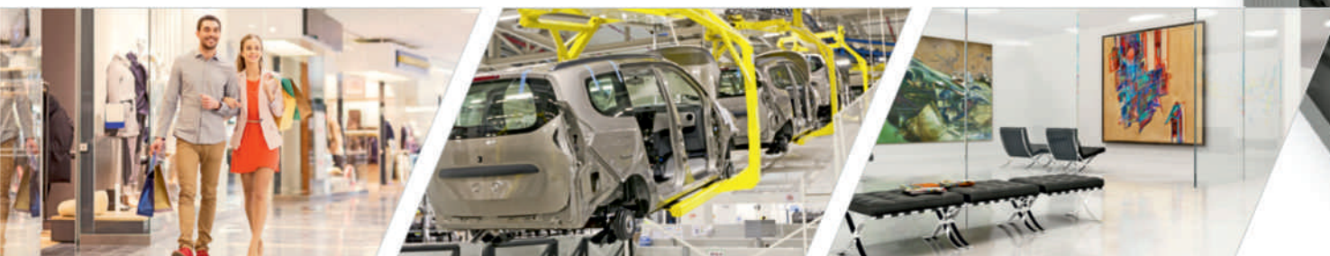
Ostoskeskukset ja tavaratalot