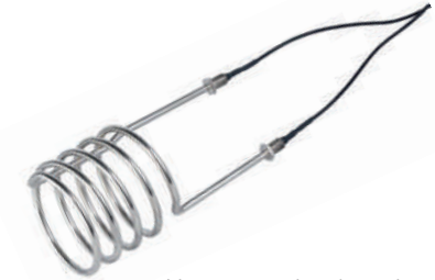
Vastustyypiset lämmityselementit erittäin korroosioresistenttiä metalliseosta