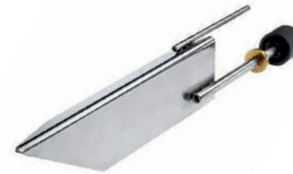
Vaihdeettavat ruostumattomat teräselektrodit, suuri pinta-ala ja hyvä johtokyky